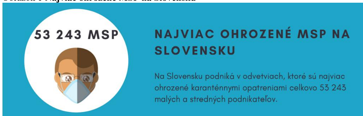
Obrázok 1 Najviac ohrozené MSP na Slovensku