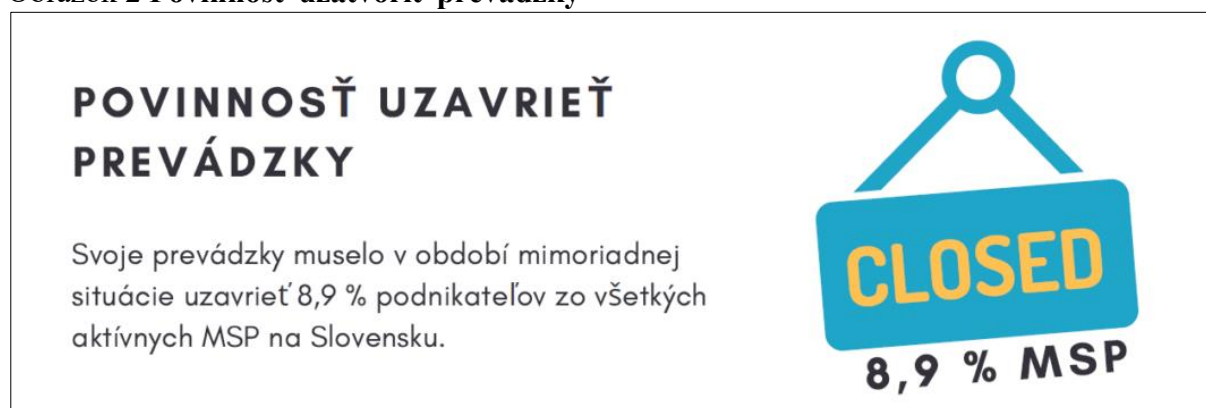
Obrázok 2 Povinnosť uzatvoriť prevádzky

Podľa klasifikácie SK NACE na Slovensku podniká v odvetviach, ktoré sú najviac ohrozené karanténnymi opatreniami celkovo 53 243 malých a stredných podnikateľov . Uvedené subjekty, ktoré boli nútené uzatvoriť svoje prevádzky tvoria 8,9 % podiel z celkového počtu aktívnych malých a stredných podnikateľov.