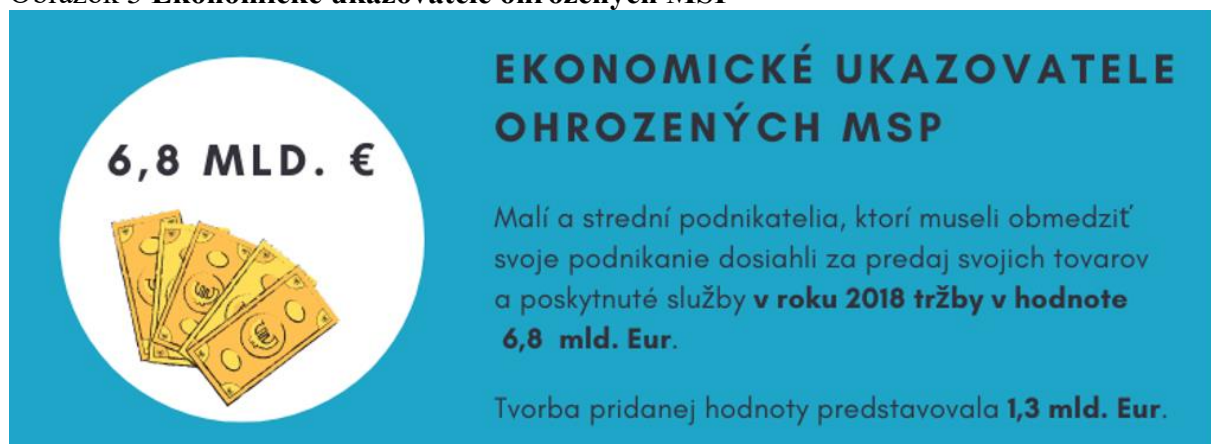
Obrázok 5 Ekonomické ukazovatele ohrozených MSP