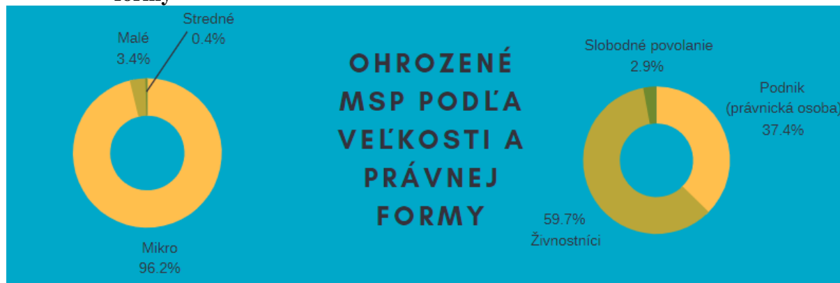
Obrázok 3 Štruktúra najviac ohrozených MSP podľa veľkostnej kategórie a právnej formy